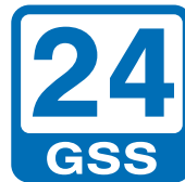
GSS 24 PLUS Sistema de seguridad para vapor con exención de operación hasta un máximo de 24 h