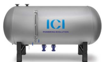
DEG Desgasificador atmosférico