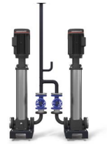
GRUPO DE ALIMENTACIÓN DE AGUA MODULANTE (Opcional con Inversor a bordo de las bombas)