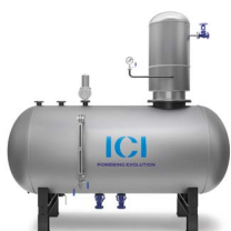
DEG/P Desgasificador presurizado