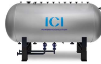
VEX Acumulador de vapor