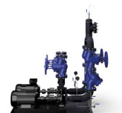
PMX Grupo de circulación del aceite de reserva