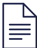
SERVICE LEVEL AGREEMENT 11 servicios gestionados, 4 niveles de oferta